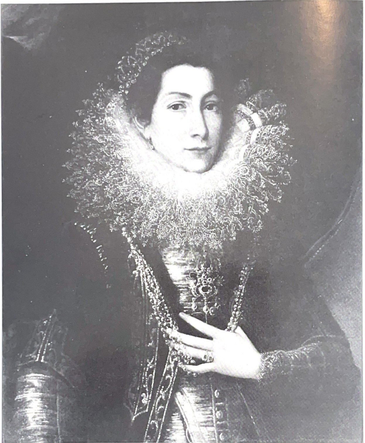
136. Rubens, A Lady (No. 52). Whereabouts unknown